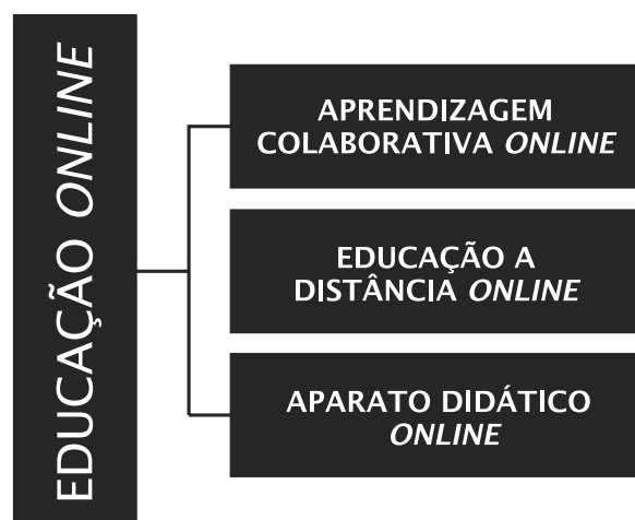
Figura 1 – Educação online e as três pedagogias que abarca